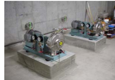
浸出水処理水を場外へ送水する新たなポンプを設置しました。