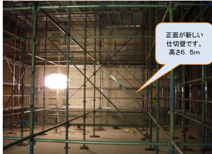
正面が新しい 仕切壁です。 高さ6.5m

浸出水処理水を場外へ送水する前に、一時貯留するための水槽が必要です。このため、既存の水槽を改造して、仕切壁を造ります。仕切壁のコンクリート工事が完了しました。