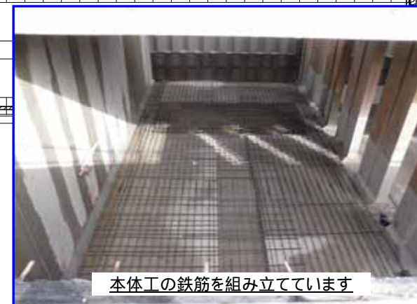
本体工の鉄筋を組み立てています