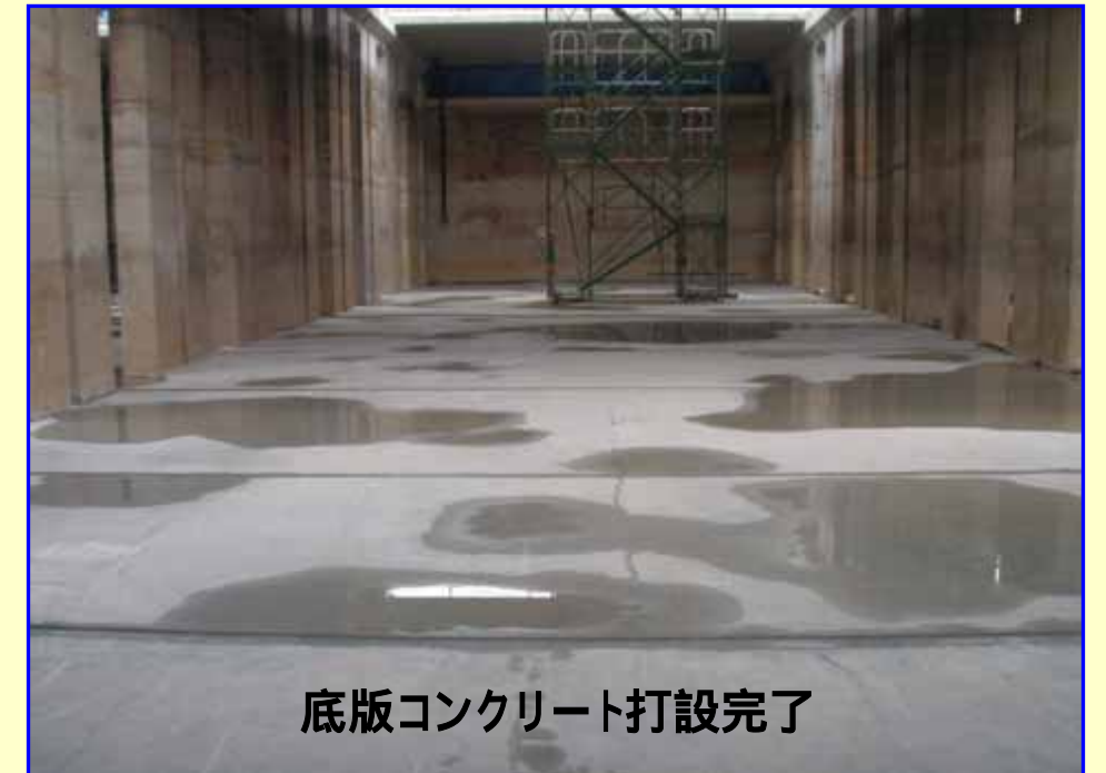
底版コンクリート打設完了