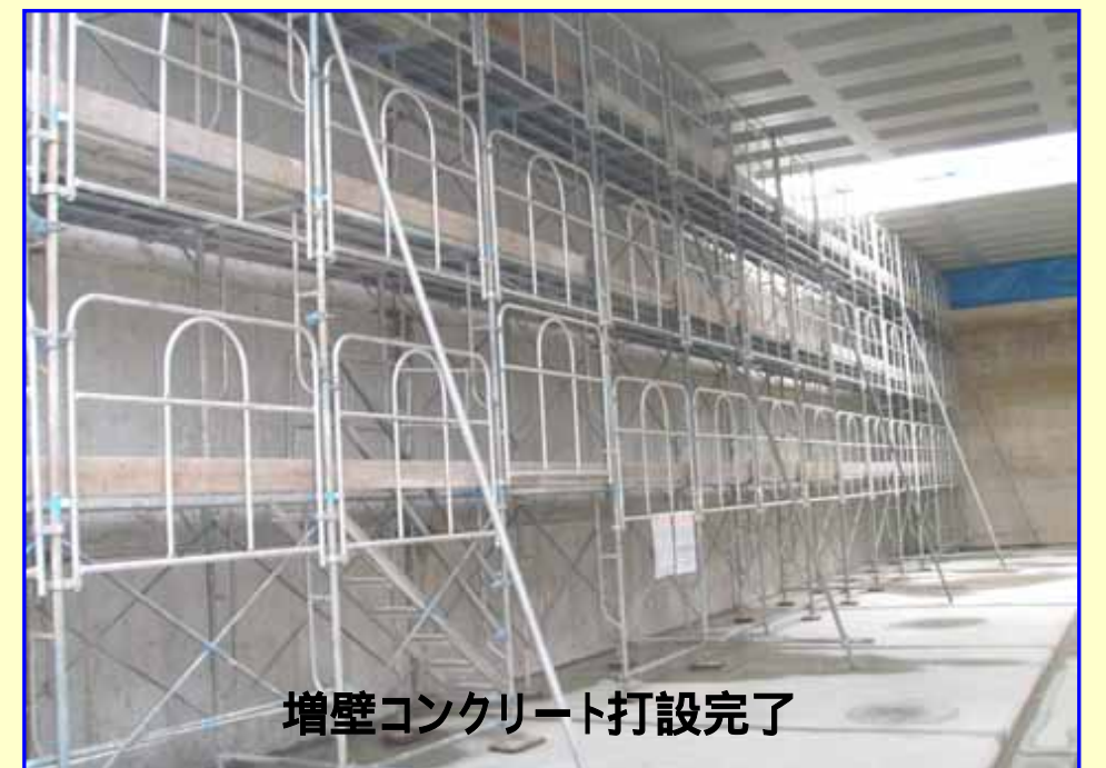
増壁コンクリート打設完了