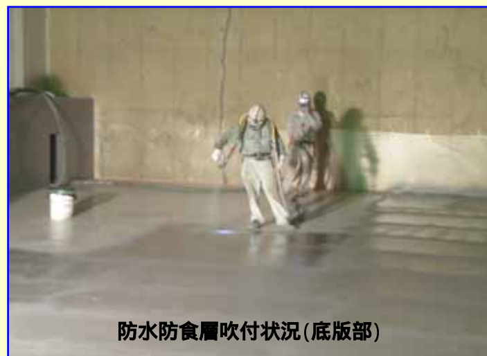
防水防食層吹付状況(底版部)